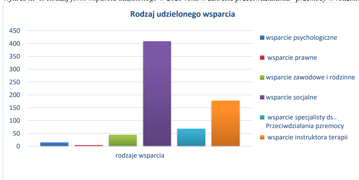
Wykres nr 4: Rodzaj form wsparcia udzielonego w 2021 roku w zakresie przeciwdziałania przemocy w rodzinie