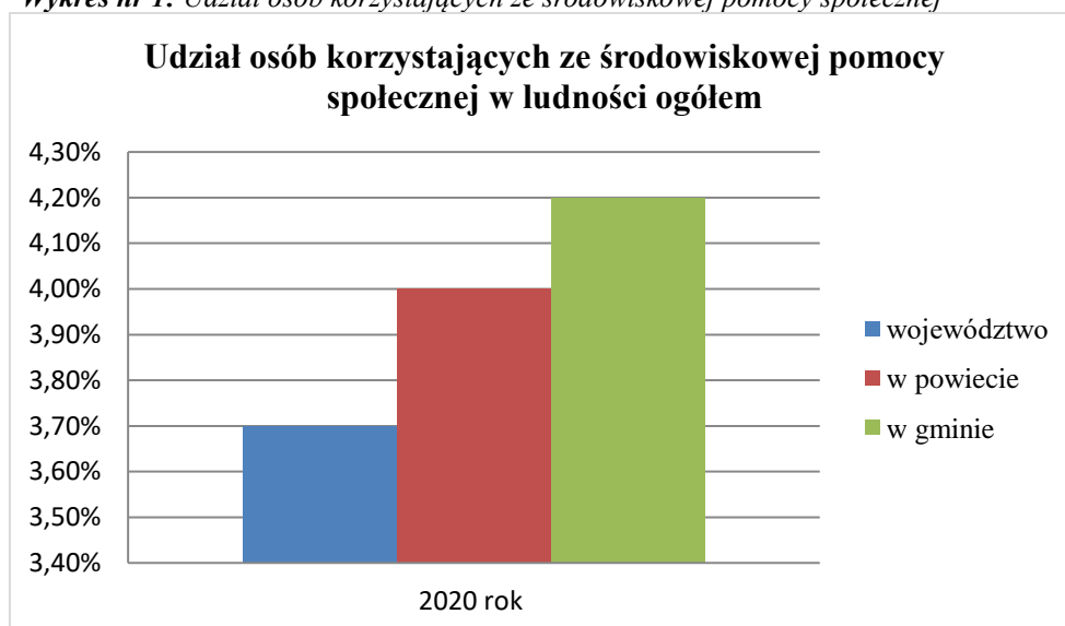
Wykres nr 1: Udział osób korzystających ze środowiskowej pomocy społecznej

Gmina Chrzanów zajmuje obszar 79,33 km 2 , co stanowi 21,35% powierzchni powiatu.