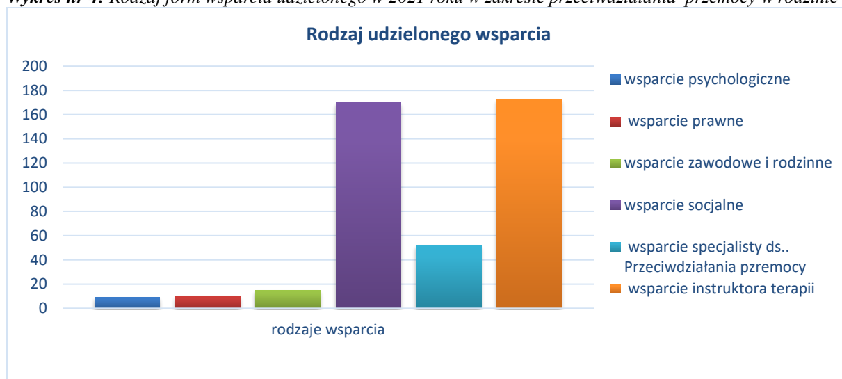
Wykres nr 4: Rodzaj form wsparcia udzielonego w 2021 roku w zakresie przeciwdziałania przemocy w rodzinie